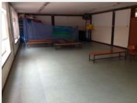
Figura 6. Polivalente