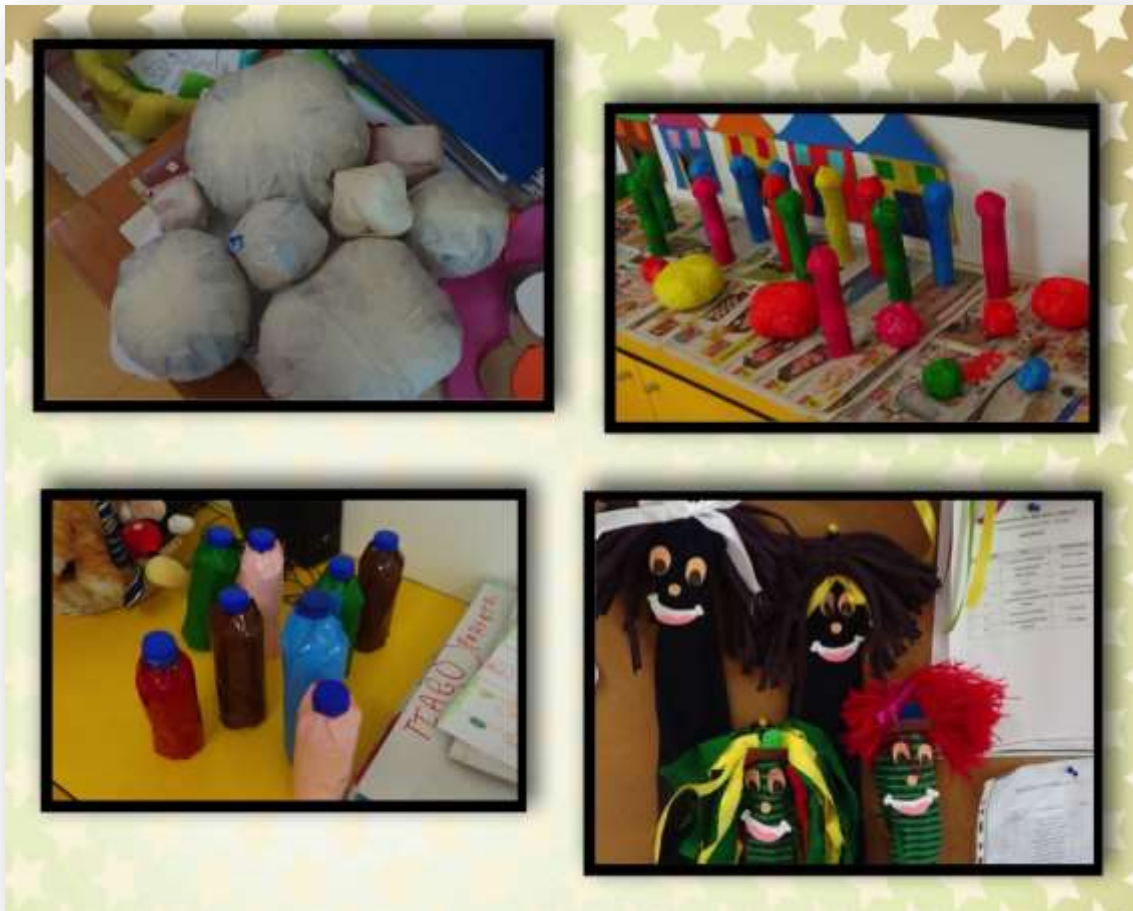
Figura 22. Desenvolvimento da atividade "Economizar com a Expressão Plástica"

O envolvimento das crianças denotava-se através de comentários e diálogos entre elas onde em diferentes contextos como o recreio e o contexto familiar. Foi possível perceber que os participantes comentavam o trabalho que estava a ser desenvolvido.