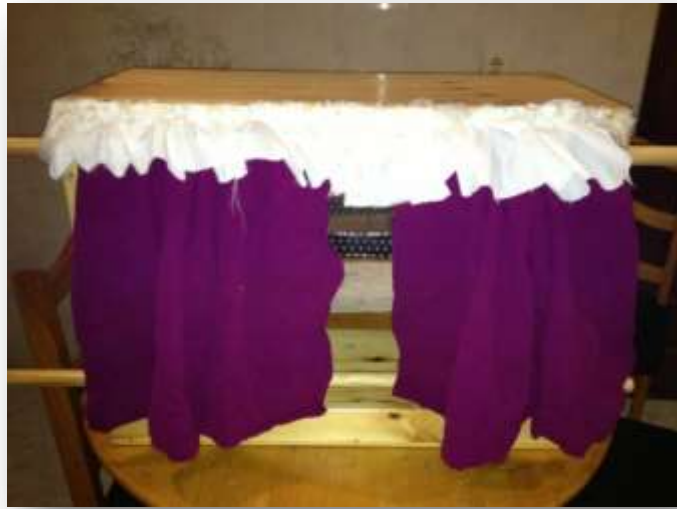
Figura 14. Cineminha.

LM: “Vamos ver um filme, a Sofia trouxe o cinema!” DP: “Gosto tanto de ouvir histórias pelo cineminha!”