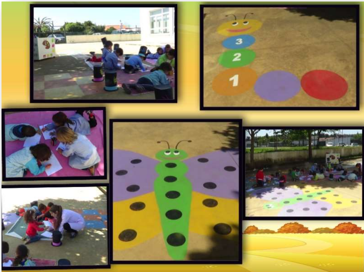
Figura 19. Realização da 2ª Tarefa - "O Recreio da minha escola"

Com a finalidade desta atividade podemos retirar algumas evidências que, estão patenteadas na grelha 4.