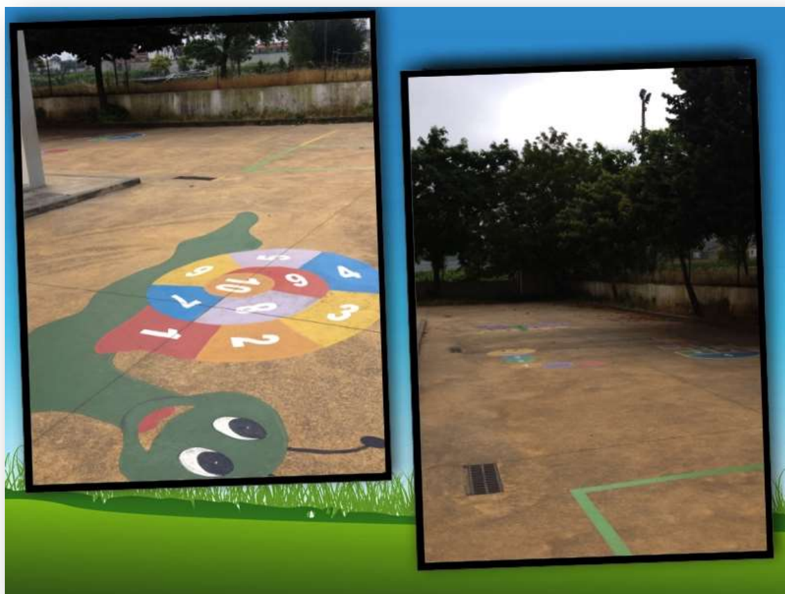
Figura 2. Recreio

Este edifício é constituído por dois andares, onde no rés-do-chão existe uma sala destinada ao prolongamento de horário (figura 3), uma biblioteca (figura 4), duas salas de reuniões para as educadoras (figura 5), um polivalente (figura 6), uma cantina (figura 7) e duas salas de atividades.