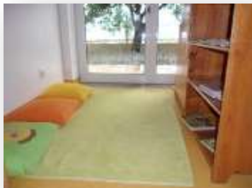
Figura 9. Cantinho da biblioteca

Dispõe também de um quadro magnético (figura 12), utilizado para atividades de rotinas diárias. Nesta sala existe também um lavatório (figura 13) disponível para as crianças lavarem as mãos sempre que realizarem alguma atividade que o exija.