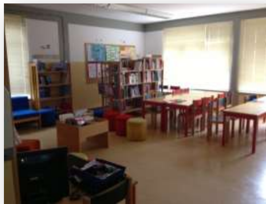
Figura 4. Biblioteca