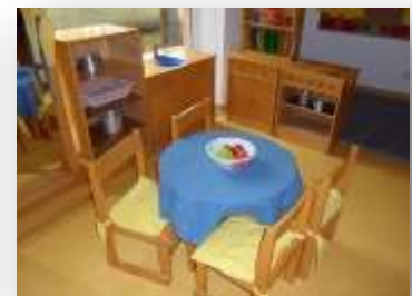
Figura 11. Cantinho da casinha