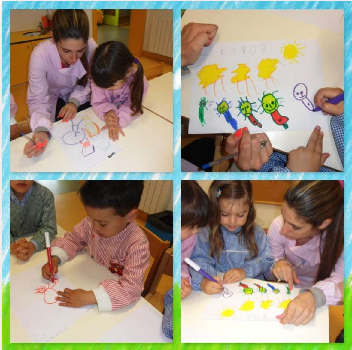
Figura 21. Realização da 4ª Tarefa - "O retrato da minha família"

De modo a ser possível estabelecer uma comparação entre o desenvolvimento inicial das crianças aquando da realização da primeira tarefa desta atividade, realizamos uma nova grelha onde apresentámos os resultados das crianças evidenciados nesta última tarefa.