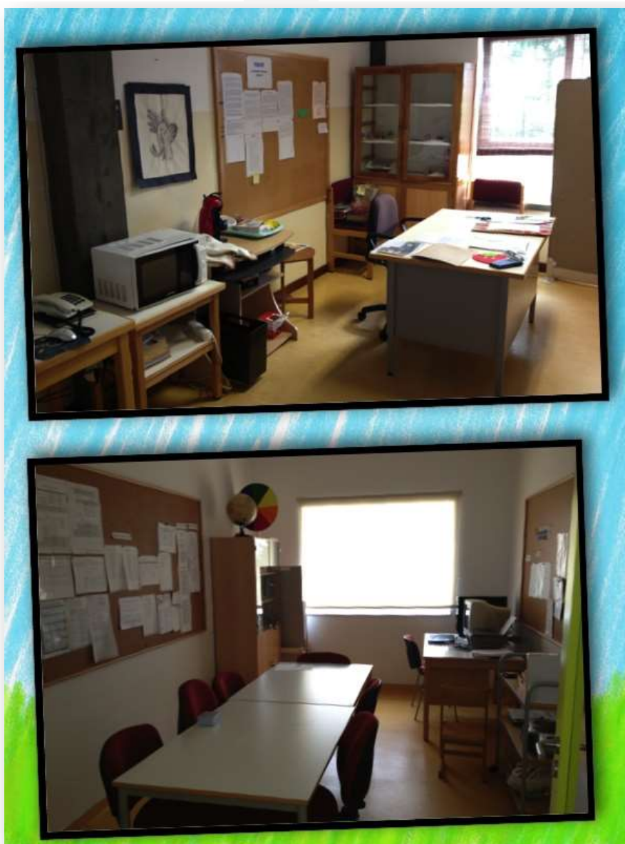
Figura 3. Sala de reuniões das educadoras