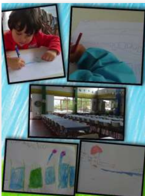
Figura 20- Realização da 3ª Tarefa - "A nossa cantina"

Já na cantina cada grupo sentava-se numa das mesas que constituía este espaço, onde tinham uma visão privilegiada de todo o espaço. Assim neste desafio o grupo deveria desenhar alguns dos detalhes e cores correspondentes a objetos presentes neste espaço do jardim-de-infância (figura 20).