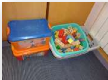
Figura 10. Jogos de chão