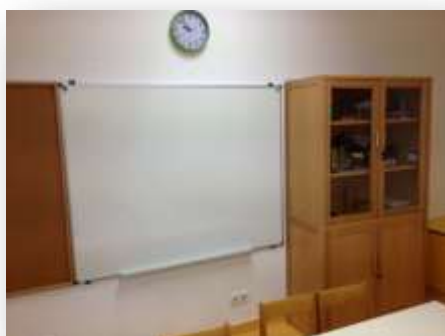
Figura 12. Quadro Magnético