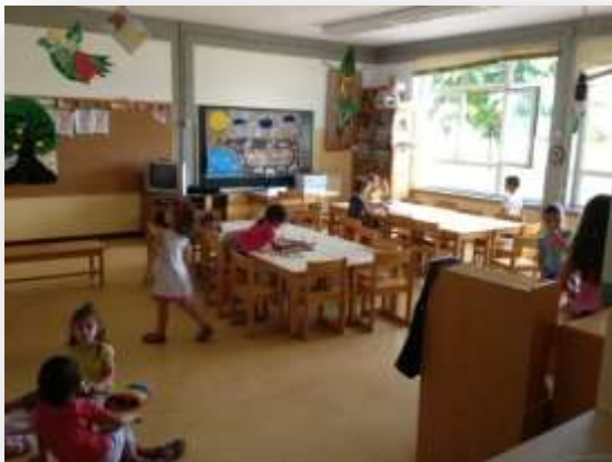
Figura 3. Sala de prolongamento