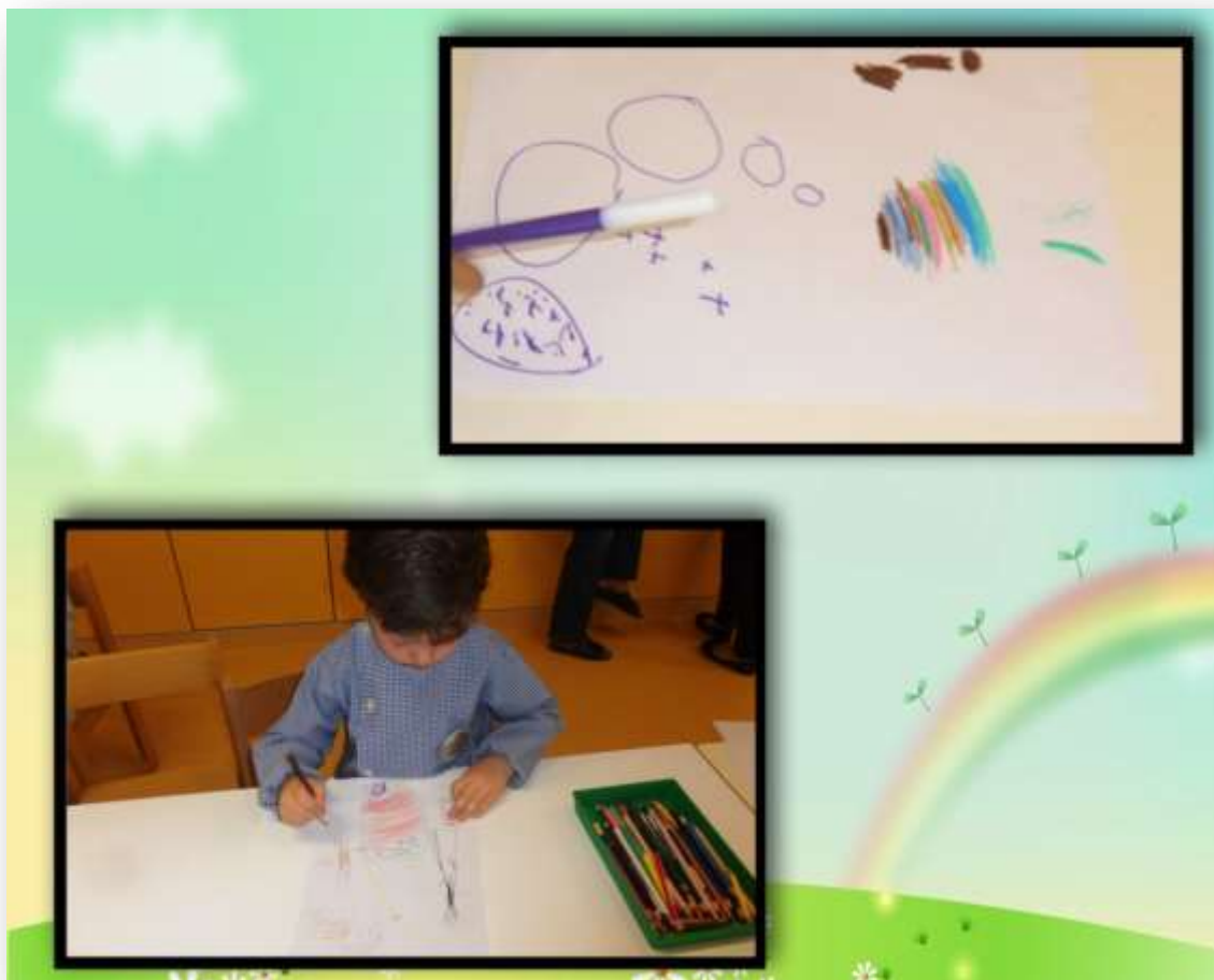
Figura 15. Alguns trabalhos realizados pelas crianças

Em suma, considero que esta atividade foi bem conseguida na medida em que o cineminha foi um elemento a destacar no envolvimento das crianças e que a maior parte do grupo mostrou interesse em aderir ao desafio colocado.