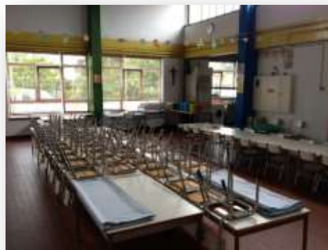
Figura 7. Cantina