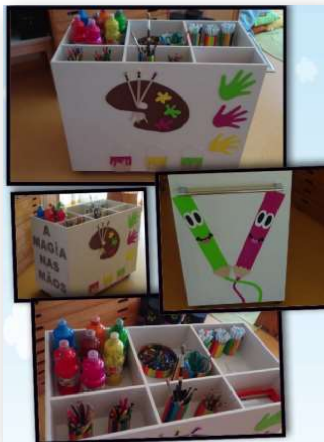
Figura 17. Móvel em diferentes perspetivas

Passei assim a retirar o pano que cobria o material e expliquei a funcionalidade que este iria ter na nossa sala de atividades e nos trabalhos realizados pelas crianças. Assim, expliquei que na parte superior do móvel se encontravam copos com lápis de cor, lápis de cera e marcadores. Já nas gavetas se encontravam as folhas A4, assim como cartolinas e papel crepe e na última gaveta que apresentava umas dimensões distintas, continha os frascos de tinta e recipientes para colocar as mesmas. Na figura abaixo ilustrada podemos visualizar diferentes perspetivas do móvel (figura 17).