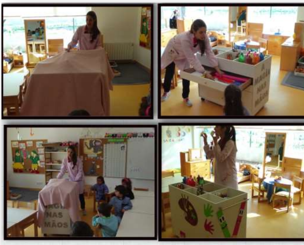
Figura 16. Apresentação do cantinho móvel - A Magia nas Mãos

A reação do grupo foi imediata na medida em que prontamente se deslocaram até ao cantinho móvel com o intuito de o explorar.