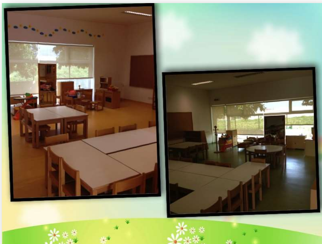
Figura 1. Sala de atividades: sala 1 e sala 2

O jardim-de-infância onde decorreu este projeto está inserido no agrupamento de escolas do Monte da Ola, situado no Concelho de Viana do Castelo. Este contexto escolar partilha o mesmo espaço que a Escola do 1º ciclo do Ensino Básico, é composto por duas salas de atividades (figura 1) abarcando 39 crianças.