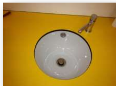
Figura 13. Lavatório da sala 2