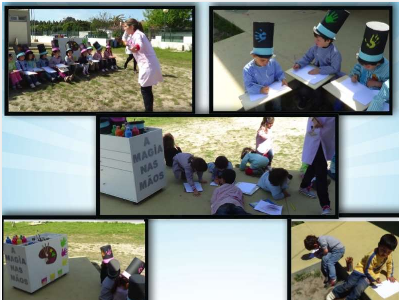
Figura 18. Realização da 1ª tarefa "A Natureza"

No decorrer desta atividade, foi notório o envolvimento do grupo onde destaco algumas afirmações das crianças perante o que observavam: