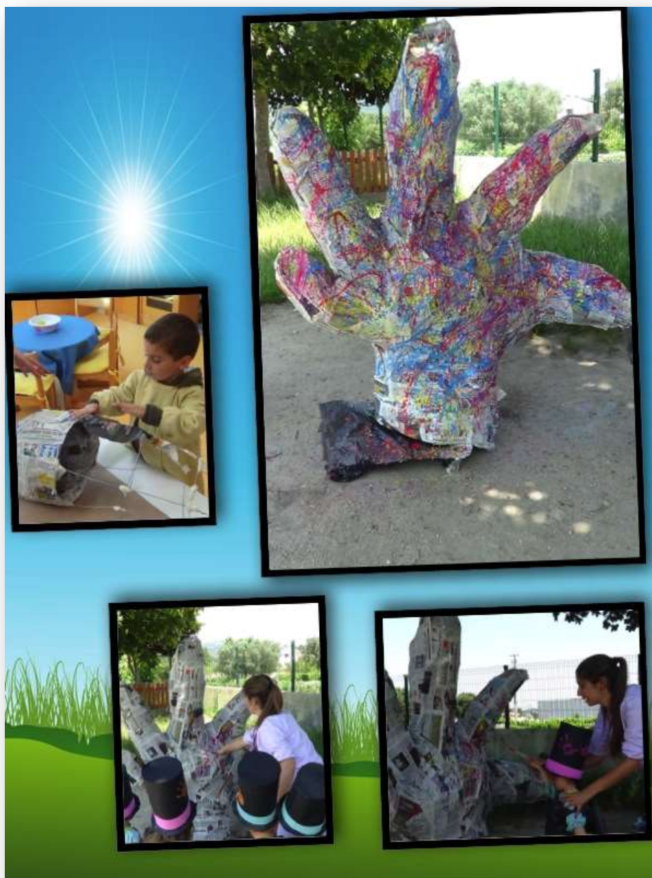
Figura 23. Desenvolvimento da atividade "Mão Gigante"