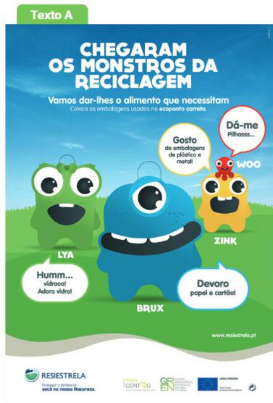
Figura 8 - Anúncio publicitário

Ainda no tema da Cidadania global, o manual apresenta um roteiro (figura 9) que promove de modo direto e explícito este tema. Através de leitura e análise do texto, facilmente os alunos reconheceriam que o texto, para além de apresentar um mapa das espécies do zoo, tem também como objetivo alertar/conscienciar os visitantes para a questão das espécies em extinção, não esquecendo que apresenta informações importantes sobre as origens, habitat e características das espécies. Este anúncio permite aos alunos trabalharem questões relacionadas com a biodiversidade, diversidades dos seres vivos e seus habitats, entre outros.