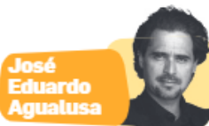
José Eduardo Águalusa

José Eduardo Águalusa nasceu no Huambo, Angola, em 1960. Estudou Silvicultura e Agronomia em Lisboa. Escreve crónicas para o jornal brasileiro O globo , a revista LER e o portal Rede Angola . Foi vencedor do Grande Prémio de Conto Camilo Castelo Branco (1999), do Grande Prémio Calouste Gulbenkian de Literatura para Crianças e Jovens (2002) e do Prémio Fernando Namora (2013). Para os mais jovens escreveu, entre outros, o livro Estranhões e bizarros . Os seus livros encontram-se traduzidos em 25 idiomas.