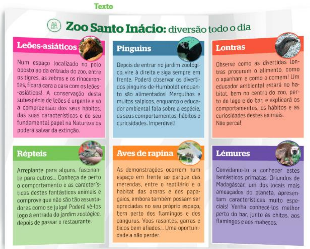
Figura 9 – Roteiro

Outro texto em que é explorada a temática da Cidadania Global é através do texto dramático “Outono faz-me falta” de Vergílio Alberto Vieira (anexo8). Este texto promove de modo explícito o subtema construção de uma sociedade mundial justa e sustentável, de modo a refletir sobre o significado de sociedade mundial sustentável, hábitos de consumo e estilo de vida sustentáveis.